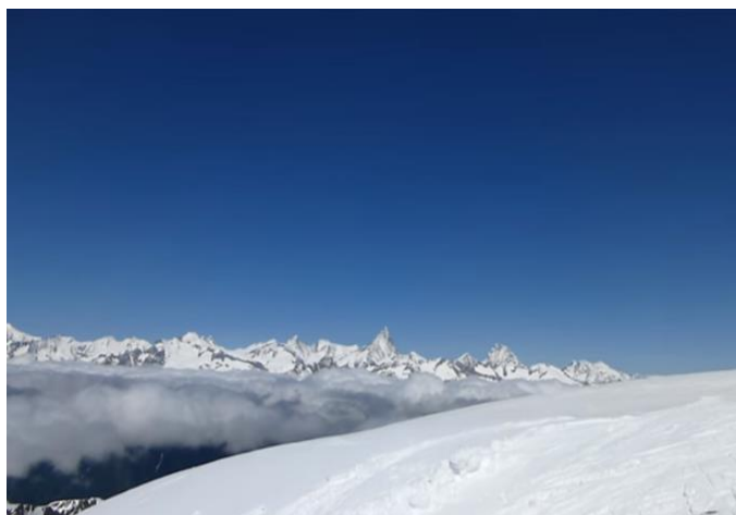
Blinnenhorn 3374 m