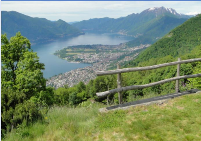
Blick auf das Delta der Maggia