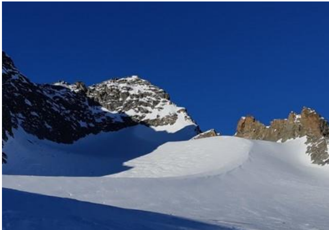
Piz Kesch 3417 m