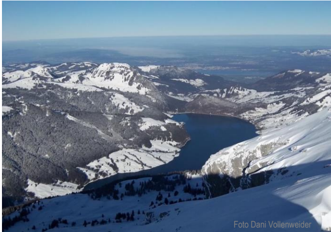
Mutteristock 2294 m, Nordcouloir